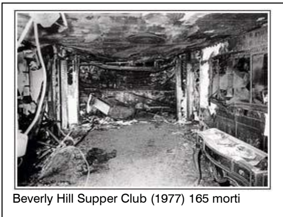
Beverly Hill Supper Club (1977) 165 morti

sono indotte a ricercare questi "affetti" prima di decidere di lasciare l'edificio. Aspetti analizzati proprio nell'ambito dell'incendio al Beverly Hill Supper Club a Southgate nel