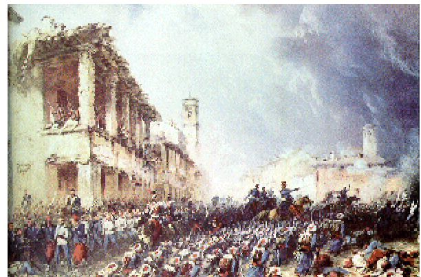
Carlo Bossoli (1815-1884) - Entrata degli zuavi nella piazza del mercato di Magenta